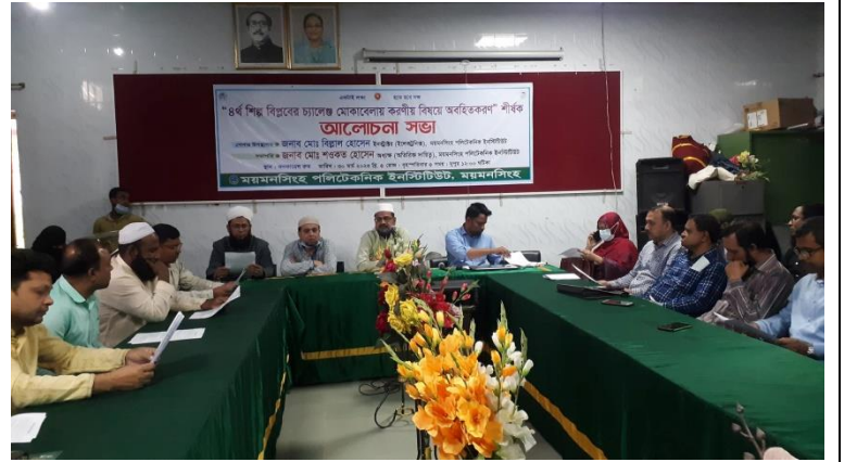
চতুর্থ শিল্প বিপ্লবের চ্যালেঞ্জ মোকাবিলায় করণীয় বিষয়ে অবহিতকরণ আলোচনা সভা এর স্থির চিত্র। তারিখঃ ৩০/০৩/২০২৩ খ্রিঃ