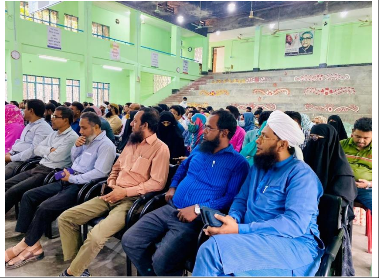
জাতীয় শুদ্ধাচার কৌশল বিষয়ক আলোচনা সভা এর স্থির চিত্র। তারিখঃ ২০/০৩/২০২৩ খ্রিঃ