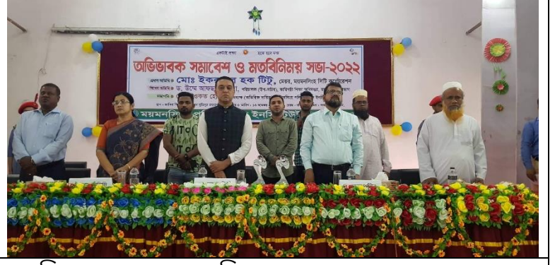
অভিভাবক সমাবেশ ও মতবিনিময় সভা-২০২২ এর স্থির চিত্র। তারিখ: ১৩/১১/২০২২ খ্রিঃ

৮.৩ চতুর্থ শিল্প বিপ্লবের চ্যালেঞ্জ মোকাবিলায় করণীয় বিষয়ে অবহিতকরণ আলোচনা সভা।