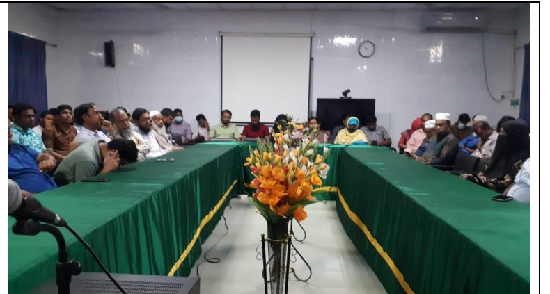
জাতির পিতা বঙ্গবন্ধু শেখ মুজিবুর রহমানের জুলিও কুরি শান্তি পদক প্রাপ্তির ৫০ বৎসর পূর্তি উপলক্ষে আয়োজিত আলোচনা সভা ও রচনা প্রতিযোগিতার পুরস্কার বিতরণী অনুষ্ঠান এর স্থির চিত্র। তারিখ: ২৩/০৫/২০২৩ খ্রিঃ