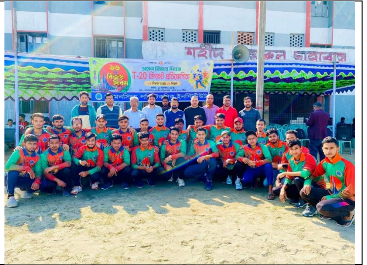
মহান বিজয় দিবস উপলক্ষে আয়োজিত T -20 ক্রিকেট প্রতিযোগিতা এর স্থির চিত্র। তারিখঃ ১৮/১২/২০২২ খ্রিঃ