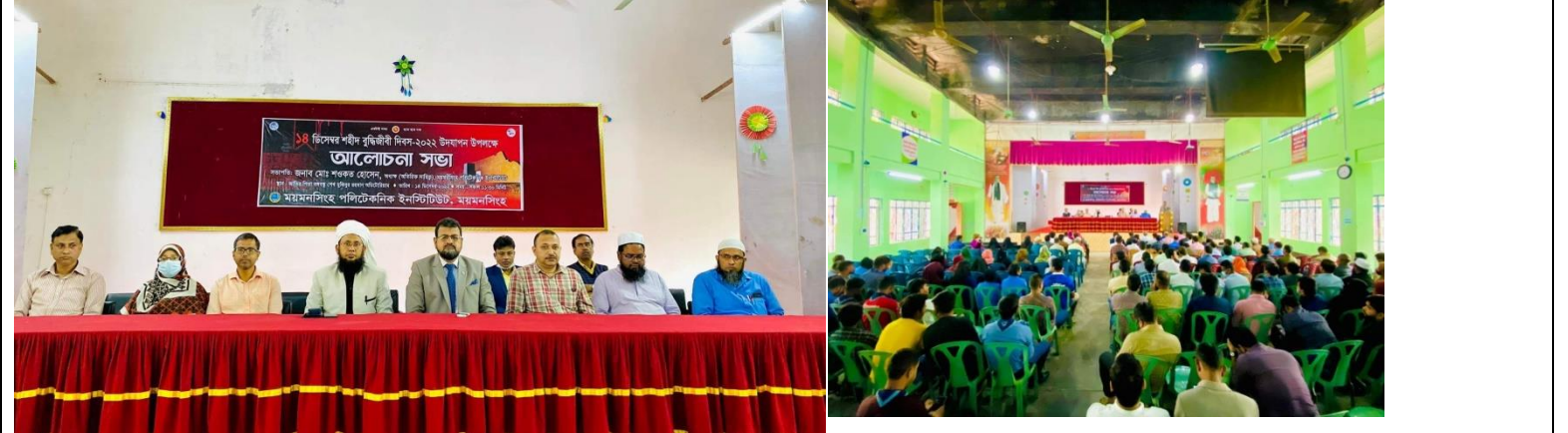
শহীদ বুদ্ধিজীবী দিবস উপলক্ষে আয়োজিত আলোচনা সভা এর স্থির চিত্র। তারিখঃ ১৪/১২/২০২২ খ্রিঃ