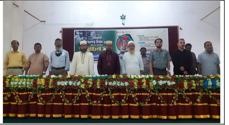
ঐতিহাসিক মুজিব নগর দিবস(১৭ই এপ্রিল) উপলক্ষে আয়োজিত আলোচনা সভা এর স্থির চিত্র। তারিখ: ১৭/০৪/২০২৩ খ্রিঃ