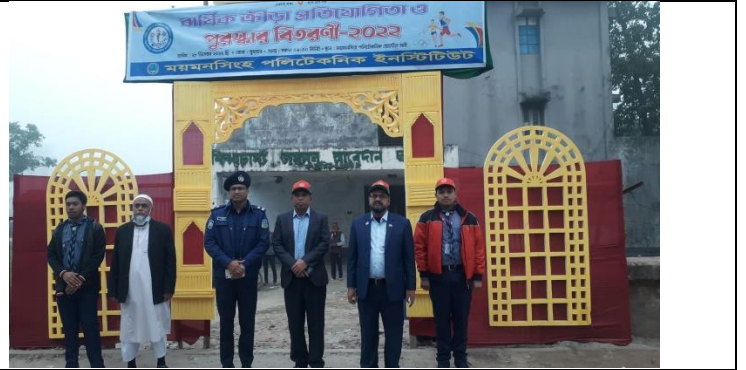
বার্ষিক ক্রীড়া প্রতিযোগিতা ও পুরস্কার বিতরণী অনুষ্ঠান এর স্থির চিত্র। তারিখঃ ২৮/১২/২০২২ খ্রিঃ