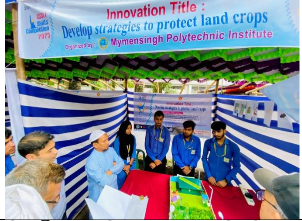
কারিগরি ও বৃত্তিমূলক শিক্ষা সপ্তাহ-২০২৩ এর সমাপনী, পুরস্কার বিতরণী ও সাংস্কৃতিক অনুষ্ঠান। এর স্থির চিত্র। তারিখ: ১৭/০৬/২০২৩ খ্রিঃ