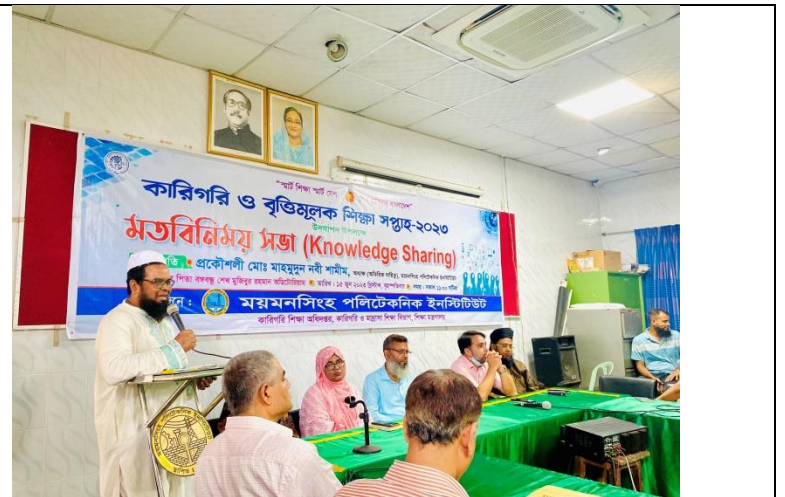
কারিগরি ও বৃত্তিমূলক শিক্ষা সপ্তাহ-২০২৩ উপলক্ষে নলেজ শেয়ারিং এর স্থির চিত্র। তারিখ: ১৫/০৬/২০২৩ খ্রিঃ