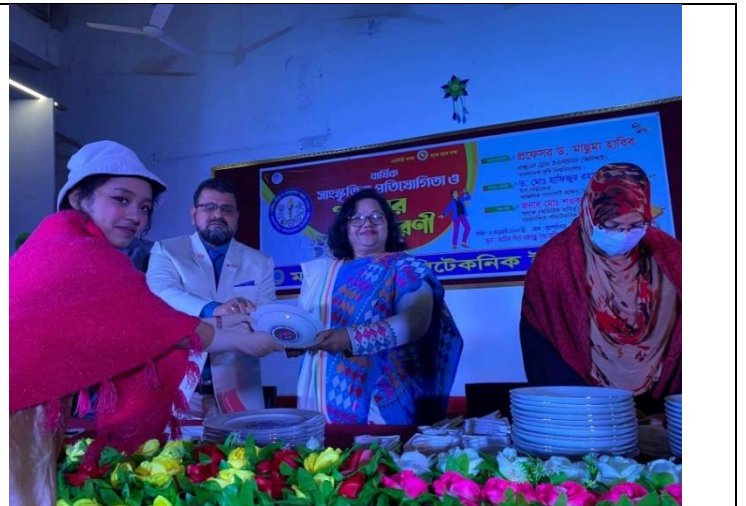
বার্ষিক সাংস্কৃতিক প্রতিযোগিতা ও পুরস্কার বিতরণী অনুষ্ঠান-২০২২ এর স্থির চিত্র। তারিখঃ ০৫/০১/২০২৩ খ্রিঃ