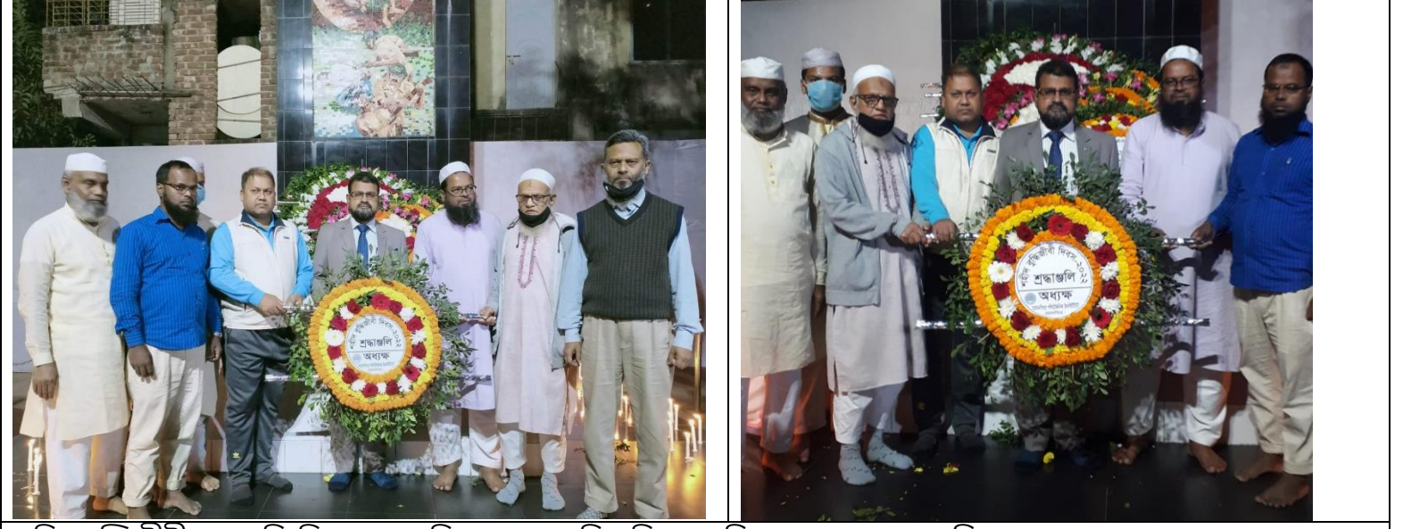
শহিদ বুদ্ধিজীবীদের প্রতি বিনম্র শ্রদ্ধা নিবেদন এর স্থির চিত্র। তারিখঃ ১৪/১২/২০২২ খ্রিঃ