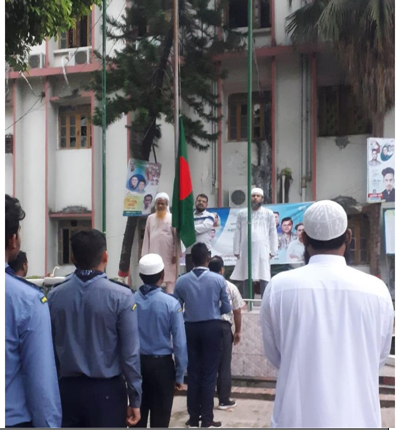
পতাকা উত্তোলনের মাধ্যমে মহান স্বাধীনতা ও জাতীয় দিবস-২০২৩ এর শুভ সূচনা এর স্থির চিত্র। তারিখঃ ২৬/০৩/২০২৩ খ্রিঃ