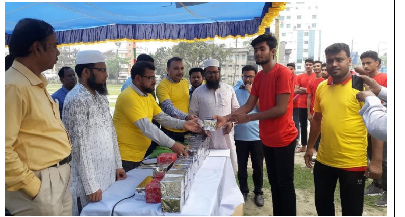
মহান বিজয় দিবস ও স্বাধীনতা দিবস-২০২৩ উপলক্ষে আয়োজিত ভলিবল প্রতিযোগিতা ও পুরস্কার বিতরণী অনুষ্ঠান এর স্থির চিত্র। তারিখঃ ২৬/০৩/২০২৩ খ্রিঃ