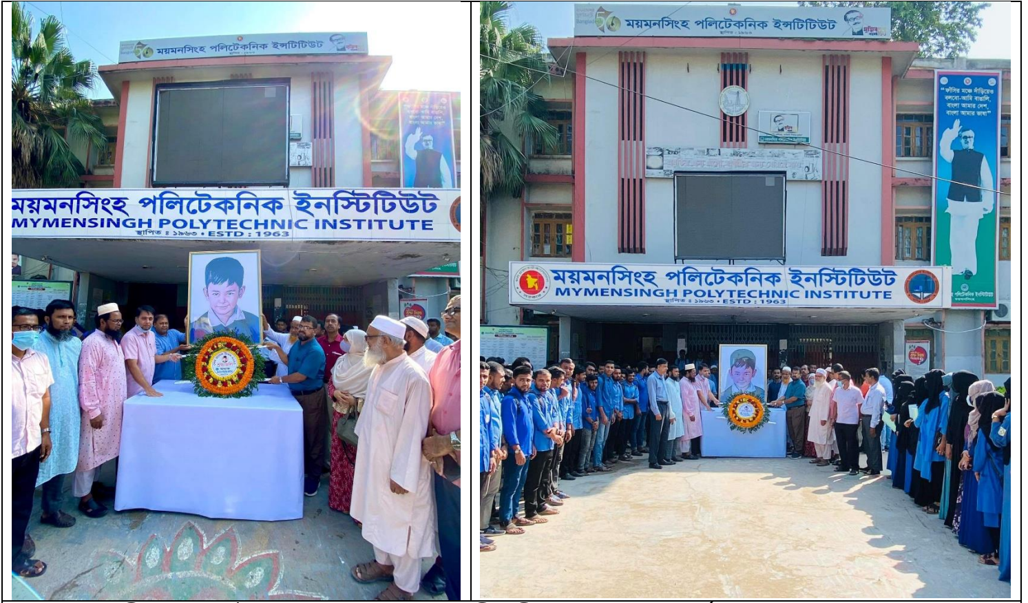
শেখ রাসেল দিবস- 2022 উপলক্ষে শেখ রাসেলের প্রতিকৃতিতে পুষ্পস্তবক অর্পণের স্থির চিত্র। তারিখ: ১৮/১০/২০২২ খ্রিঃ