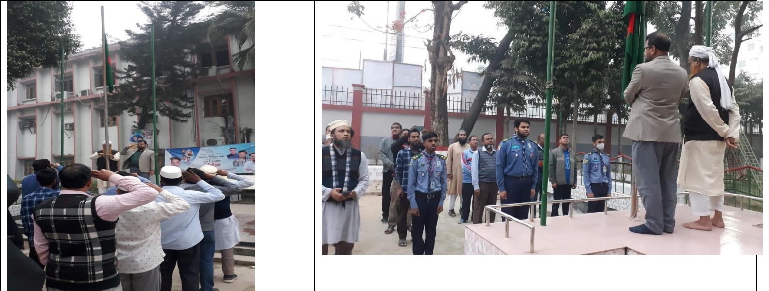
ভাষা শহিদদের স্মরণে সূর্যোদয়ের সাথে সাথে জাতীয় পতাকা উত্তোলন ও অর্ধনমিত করন এর স্থির চিত্র। তারিখঃ ২১/০২/২০২৩ খ্রিঃ

৮.১৫ ময়মনসিংহ পলিটেকনিক ইনস্টিটিউট কর্তৃক ভাষা শহিদদের স্মরণে সূর্যোদয়ের সাথে সাথে জাতীয় পতাকা উত্তোলন ও অর্ধনমিত করন।