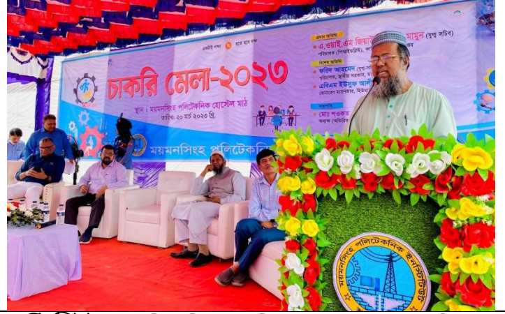
চাকরি মেলা -২০২৩। আয়োজনে-ময়মনসিংহ পলিটেকনিক ইনস্টিটিউট এর স্থির চিত্র। তারিখঃ ২০/০৩/২০২৩ খ্রিঃ