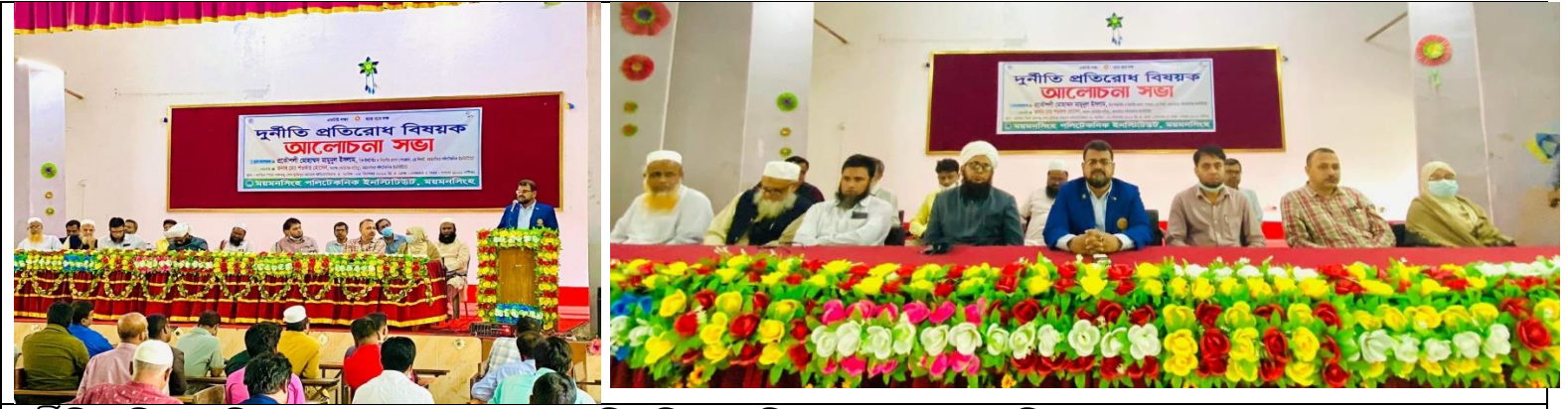
দুর্নীতি প্রতিরোধ বিষয়ক আলোচনা সভার এর স্থির চিত্র। তারিখঃ ০৫/১২/২০২২ খ্রিঃ