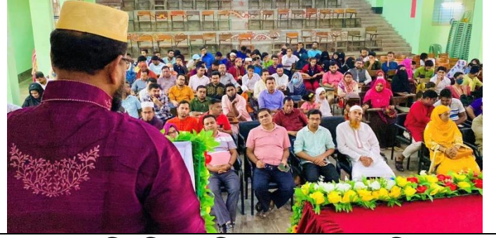
বর্ষবরণ ১৪৩০ বঙ্গাব্দ উদযাপন উপলক্ষে আয়োজিত আলোচনা সভার স্থির চিত্র। তারিখ: ১৪/০৪/২০২৩ খ্রিঃ