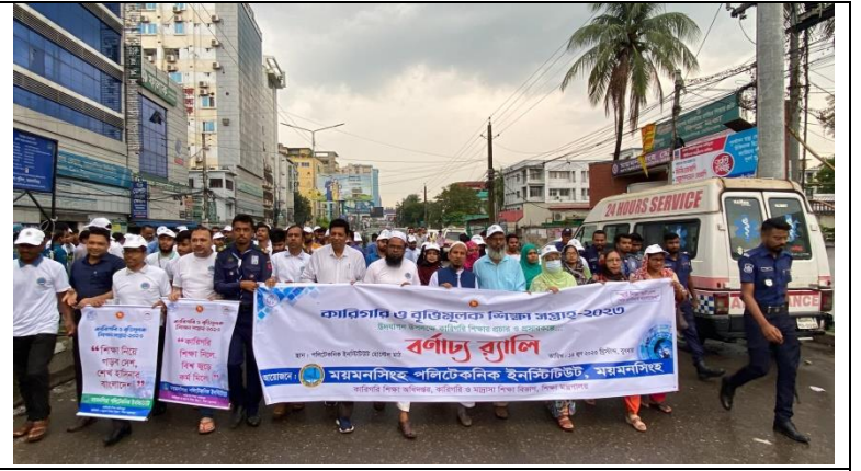
কারিগরি ও বৃত্তিমূলক শিক্ষা সপ্তাহ-২০২৩ বর্ণাঢ্য র্যালি এর স্থির চিত্র। তারিখ: ০৩/০৬/২০২৩ খ্রিঃ ১২.৩ কারিগরি ও বৃত্তিমূলক শিক্ষা সপ্তাহ-২০২৩ উপলক্ষে অভিভাবক সমাবেশ।