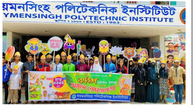
বর্ষবরণ ১৪৩০ বঙ্গাব্দ উদযাপন উপলক্ষে আয়োজিত মংগল শোভা যাত্রা এর স্থির চিত্র। তারিখঃ ১৪/০৪/২০২৩ খ্রিঃ