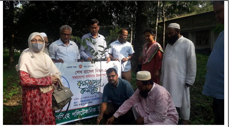
শেখ রাসেল দিবস -2022উপলক্ষে আয়োজিত বৃক্ষ রোপণ কর্মসূচী এর স্থির চিত্র। তারিখঃ ১৮/১০/২০২২ খ্রিঃ