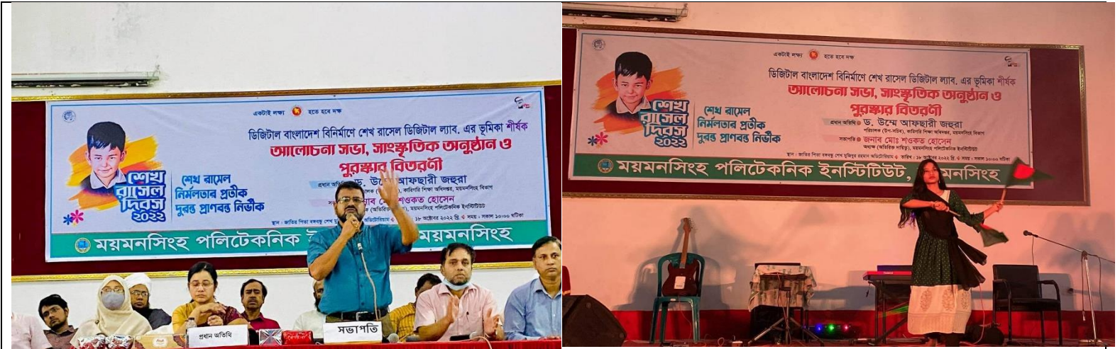
শেখ রাসেল দিবস -2022 উপলক্ষে আয়োজিত আলোচনা সভা, সাংস্কৃতিক অনুষ্ঠান ও পুরস্কার বিতরণী অনুষ্ঠান এর স্থির চিত্র। তারিখ: ১৮/১০/২০২২ খ্রিঃ