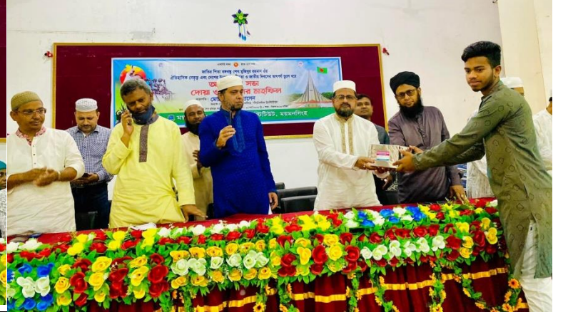
মহান স্বাধীনতা ও জাতীয় দিবস-২০২৩ উপলক্ষে আয়োজিত আলোচনা সভা ও পুরস্কার বিতরণী অনুষ্ঠান এর স্থির চিত্র। তারিখঃ ২৬/০৩/২০২৩ খ্রিঃ