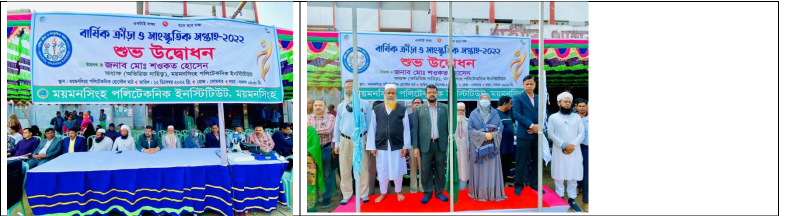
শুভ উদ্বোধন, বার্ষিক ক্রীড়া ও সাংস্কৃতিক সপ্তাহ-২০২২ এর স্থির চিত্র। তারিখঃ ০৫/১২/২০২২ খ্রিঃ