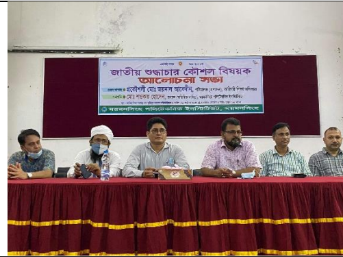
জাতীয় শুদ্ধাচার কৌশল বিষয়ক আলোচনা সভার স্থির চিত্র। তারিখঃ ১০/১০/২০২২ খ্রিঃ