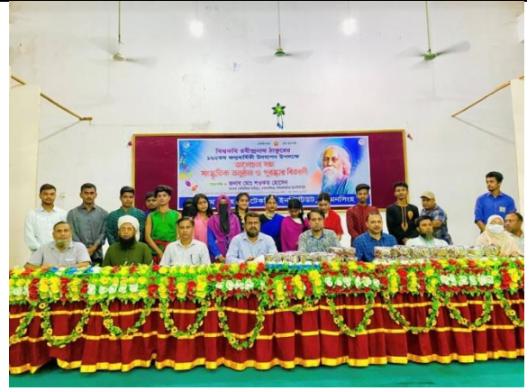
বিশ্বকবি রবীন্দ্রনাথ ঠাকুরের ১৬২ তম জন্মবার্ষিকী উদযাপন উপলক্ষে আয়োজিত আলোচনা সভা, সাংস্কৃতিক প্রতিযোগিতা ও পুরস্কার বিতরণী অনুষ্ঠান এর স্থির চিত্র। তারিখ: ০৮/০৫/২০২৩ খ্রিঃ