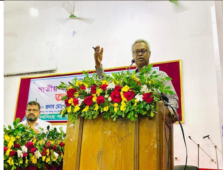
জাতীয় শুদ্ধাচার কৌশল বিষয়ক কর্মসূচী এর স্থির চিত্র। তারিখঃ ২০/১০/২০২২ খ্রিঃ