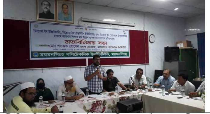
ডিপ্লোমা ইন ইঞ্জিনিয়ারিং, ডিপ্লোমা ইন টেক্সটাইল ইঞ্জিনিয়ারিং, ডিপ্লোমা ইন মেডিকেল টেকনোলজির মাধ্যমে কারিগরি শিক্ষার মান উন্নয়ন ও দক্ষ মানবসম্পদ সৃষ্টির লক্ষ্যে মতবিনিময় সভা। তারিখ: ০৮/০৮/২০২২ খ্রিঃ

৫.৪ টেকসই স্থাপনা ও দক্ষ প্রকৌশলী তৈরির লক্ষ্যে সয়েল টেস্ট এর গুরুত্ব শীর্ষক সেমিনার। আয়োজনে সিভিল টেকনোলজি, ময়মনসিংহ পলিটেকনিক ইনস্টিটিউট।