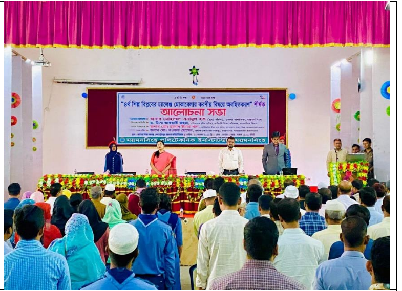
চতুর্থ শিল্প বিপ্লবের চ্যালেঞ্জ মোকাবিলায় করণীয় বিষয়ে অবহিতকরণ আলোচনা সভার এর স্থির চিত্র। তারিখ: ২৩/১১/২০২২ খ্রিঃ