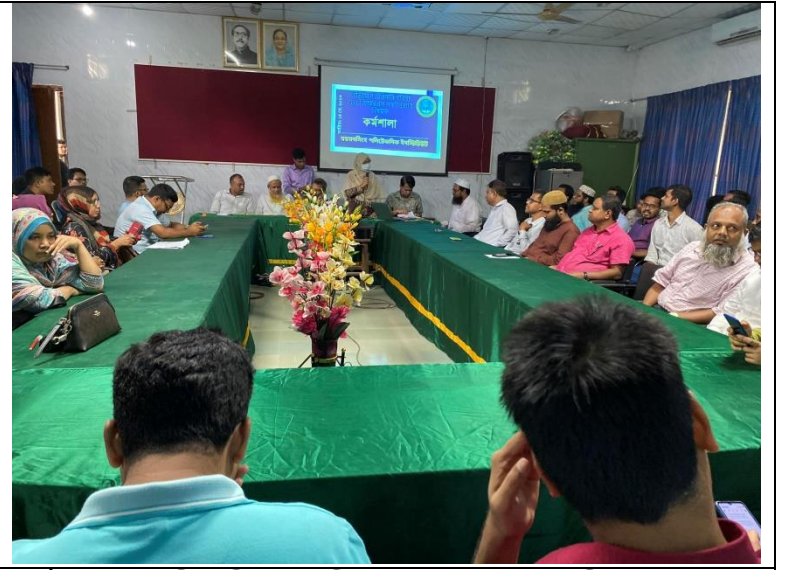
অভিযোগ প্রতিকার ব্যবস্থা এবং জিআরএস সফটওয়্যার বিষয়ক কর্মশালা এর স্থির চিত্র। তারিখ: ১৪/০৫/২০২৩ খ্রিঃ