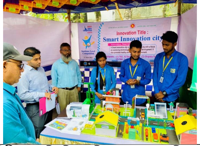
কারিগরি ও বৃত্তিমূলক শিক্ষা সপ্তাহ-২০২৩ উপলক্ষে স্কিলস কম্পিটিশন এর স্থির চিত্র। তারিখ: ১৭/০৬/২০২৩ খ্রিঃ