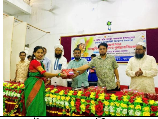
জাতীয় কবি কাজী নজরুল ইসলামের ১২৪ তম জন্মবার্ষিকী উদযাপন উপলক্ষে আয়োজিত আলোচনা সভা ,সাংস্কৃতিক ও রচনা প্রতিযোগিতা ও পুরস্কার বিতরণী অনুষ্ঠান এর স্থির চিত্র। তারিখ: ২৫/০৫/২০২৩ খ্রিঃ