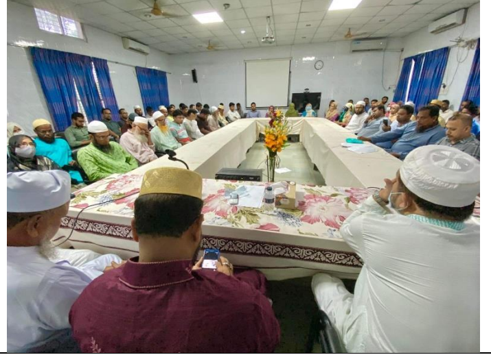
পবিত্র ঈদ-ই- মিলাদুন্নবী (সাঃ) উদযাপন উপলক্ষে আলোচনা সভা ও মিলাদ মাহফিলের স্থির চিত্র। তারিখঃ ০৯/১০/২০২২ খ্রিঃ