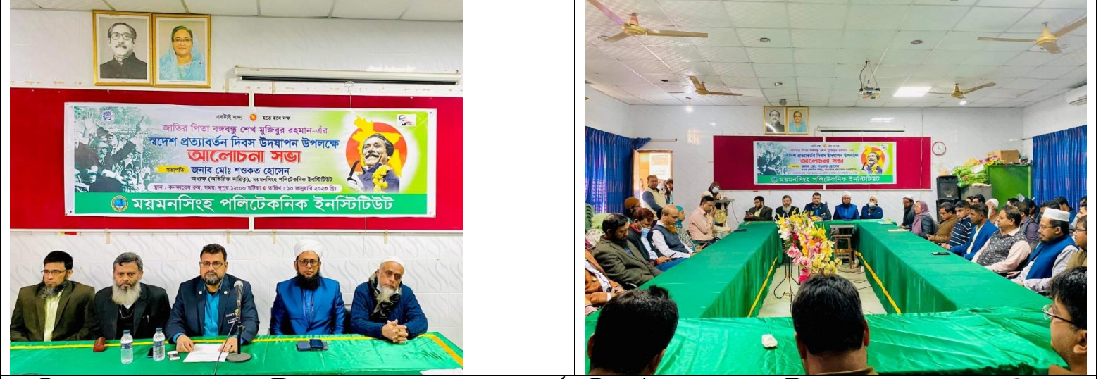
জাতির জনক বঙ্গবন্ধু শেখ মুজিবুর রহমান এর স্বদেশ প্রত্যাবর্তন দিবস উপলক্ষে আয়োজিত আলোচনা সভা এর স্থির চিত্র। তারিখঃ ১০/০১/২০২৩ খ্রিঃ

৮.১৪ জাতির জনক বঙ্গবন্ধু শেখ মুজিবুর রহমান এর স্বদেশ প্রত্যাবর্তন দিবস উপলক্ষে আয়োজিত আলোচনা সভা।