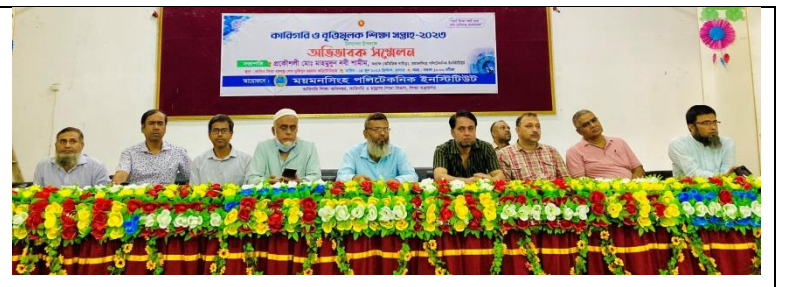
কারিগরি ও বৃত্তিমূলক শিক্ষা সপ্তাহ-২০২৩ উপলক্ষে অভিভাবক সমাবেশ এর স্থির চিত্র। তারিখ: ১৪/০৬/২০২৩ খ্রিঃ