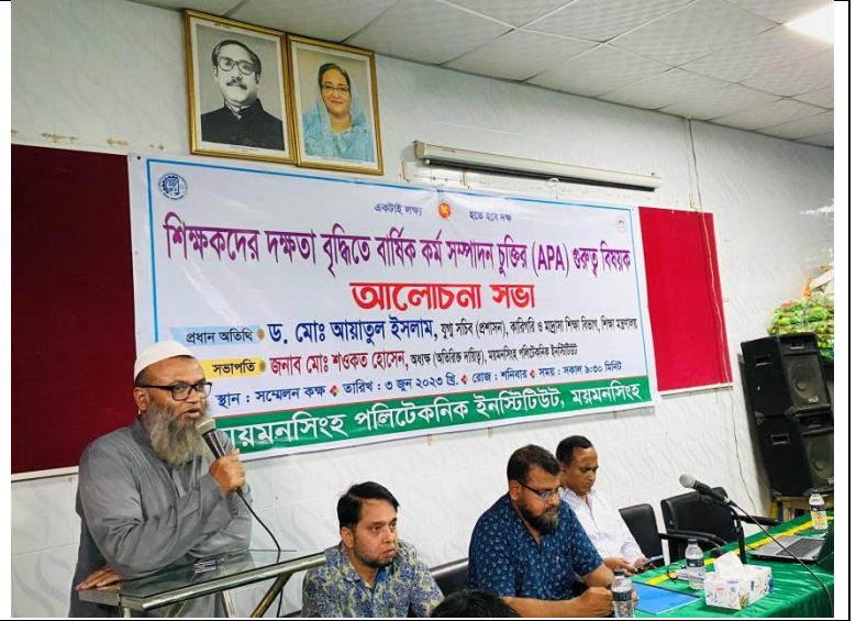
শিক্ষকদের দক্ষতাবৃদ্ধিতে বার্ষিক কর্ম সম্পাদন চুক্তির গুরুত্ব বিষয়ক আলোচনা সভা এর স্থির চিত্র। তারিখ: ০৩/০৬/২০২৩ খ্রিঃ