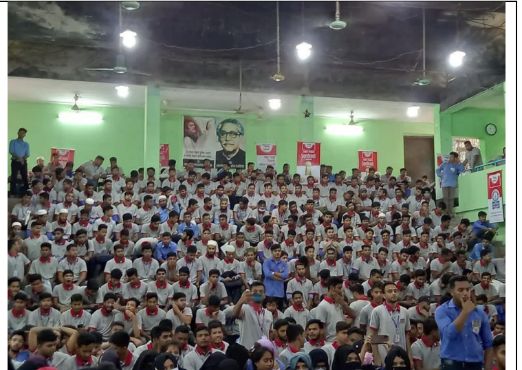
টেকসই স্থাপনা ও দক্ষ প্রকৌশলী তৈরির লক্ষ্যে সয়েল টেস্ট এর গুরুত্ব শীর্ষক সেমিনার। আয়োজনে সিভিল টেকনোলজি, ময়মনসিংহ পলিটেকনিক ইনস্টিটিউট। তারিখ: ০৯/০৮/২০২২ খ্রিঃ